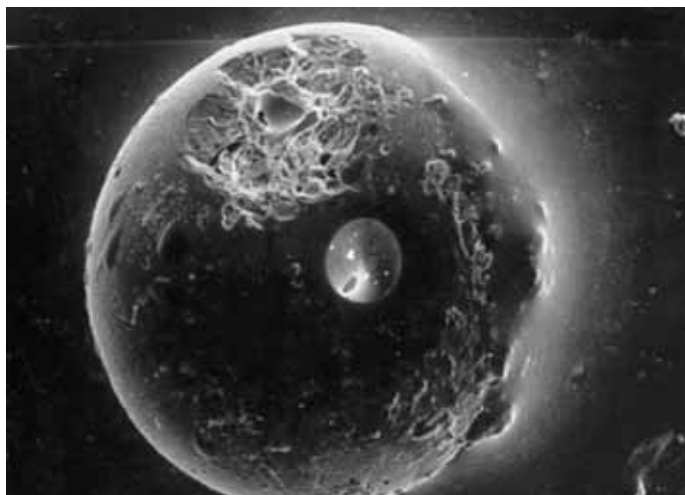
圖 3. 月球表面發現大量的琉璃球狀結構。

看來似乎是驅動著化學反應偏袒左旋氨基酸分子結構多於右旋結構的機制，但最近 Sandra Pizzarello 已發現過量的鏡像物數值遠比以偏振光為主要因素的理论數值高很多。而 Hill 和 Nuth 研究團隊支持另一個新的可能構想，是由於塵埃粒的「琉璃催化」(Metal-catalyzed)反應（圖 3），導致左旋和右旋的不對稱結果，正如同 Pizzarello 研究團隊所完成的實驗。至今已知，在太空中形成的分子結構在